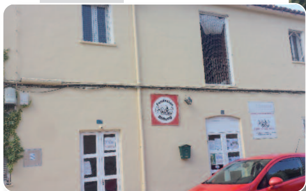
frisch gestrichene Fassade

Nach dem Ankauf des Tierheimgeländes holten wir erst einmal tief Luft. In den letzten Monaten, mit der Ungewissheit, schaffen wir den Ankauf oder nicht, haben wir natürlich keine Renovierungen mehr durchgeführt. Jetzt müssen wir mit hochgekrämpelten Ärmeln starten. Türen streichen, Fassade des Tierheimes erneuern, Fensterläden auswechseln, brüchige Mauern reparieren, defekte Klimaanlage erneuern, neue Liegen für die Hunde kaufen und und und.....Dazwischen die Besucher betreuen und natürlich unsere Schützlinge versorgen. Hier einige Motive, die ein wenig Einblick in diese Arbeit geben.